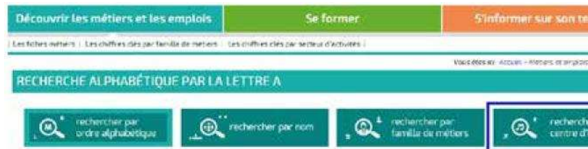
Figure 1 : La recherche par centres d'intérêts sur Orientation-paysdelaloire.fr